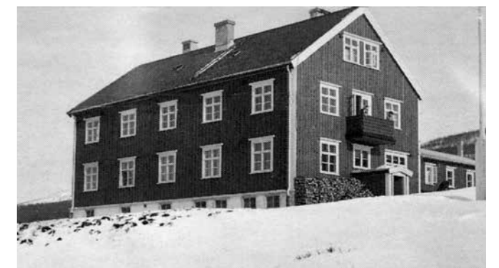
Aldershjemmet i Lebesby, bygget i 1935. Nedbrent av tyske soldater 2. november 1944.