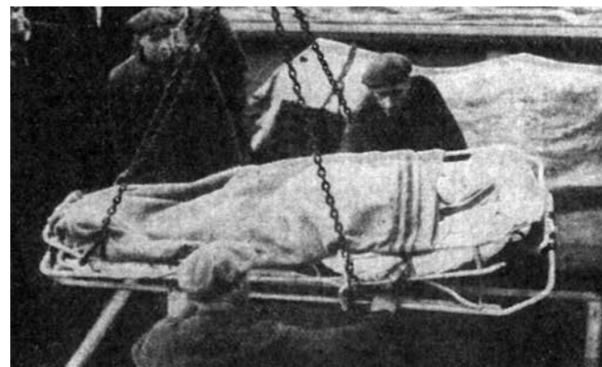
Slik ble de sykeste av Aldershjemmets pensjonærer plassert ombord på dekket i «Staværingen» for å bli ført til Stadsbygd i Trøndelag.