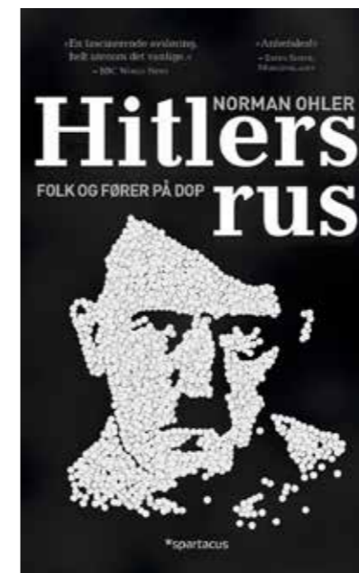
«Hitlers rus – folk og fører på dop», av Norman Ohler. BBC World News' karakteristikk av boken: «En fascinerende avsløring, helt utenom det vanlige».